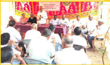
25న పెన్ననర్లు నిరసన దినం పాటించండి