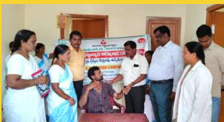
కుష్టు వ్యాధి అవగాహన కార్యక్రమం షురూ