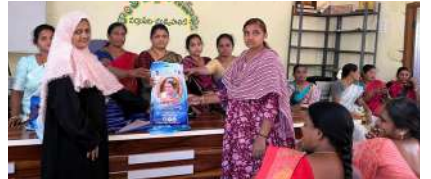
మహిళా సంక్షేమానికి కాంగ్రెస్ కృషి